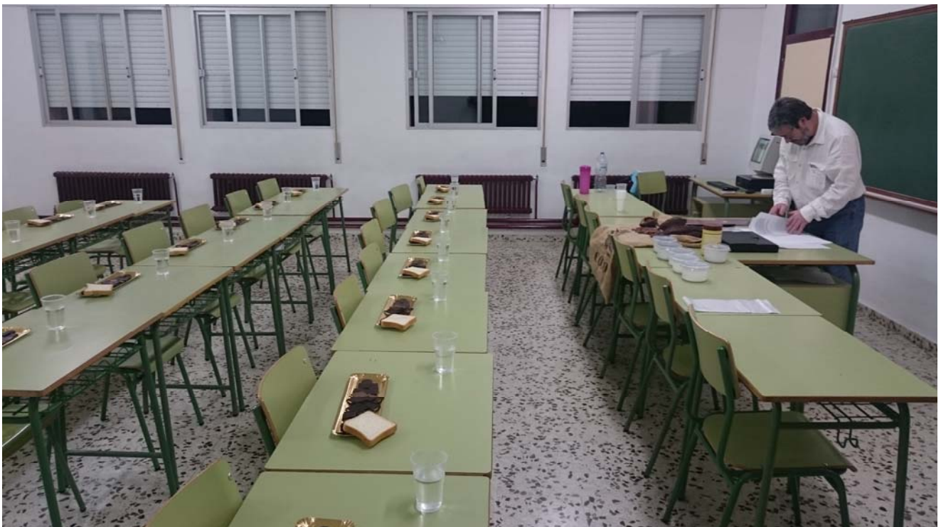
Todo listo para los participantes (chocolates variados, agua para “borrar” sabores y pan de molde de fabricación propia)