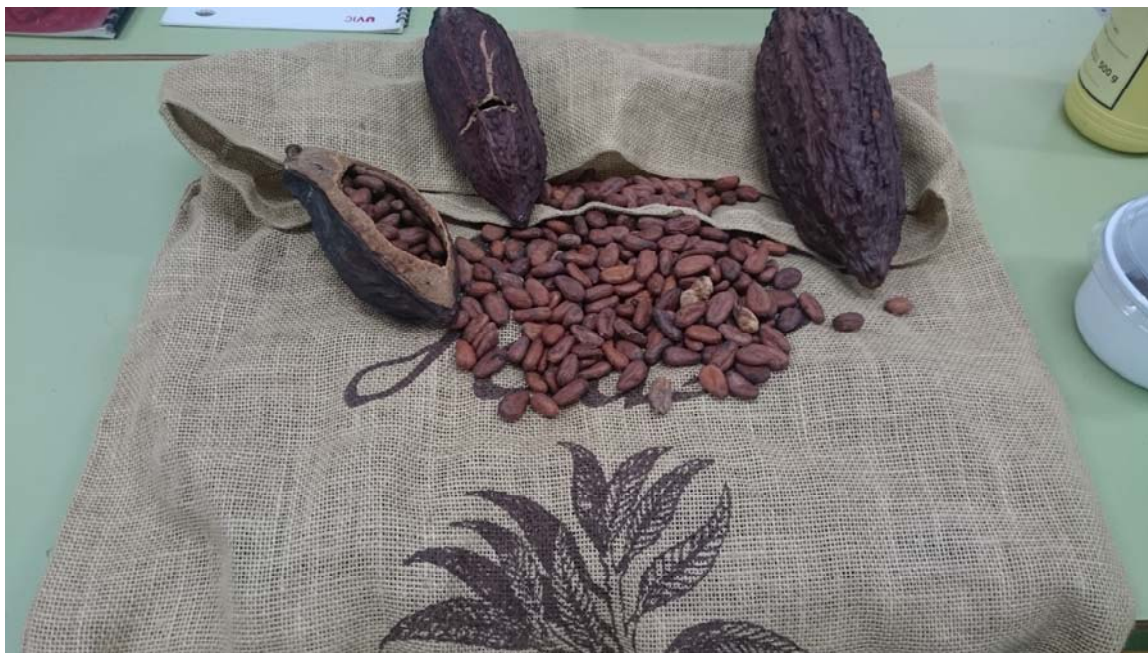
Granos de cacao tostados