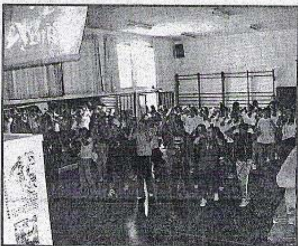
Los chicos se movieron a ritmo de batuka

buen ambiente de esta cita. "El deporte no es sólo educación, sino un estilo de vida. Su práctica crea hábitos saludables y forma en valores. Actividades como ésta lo demuestran", comentó el responsable autonómico.