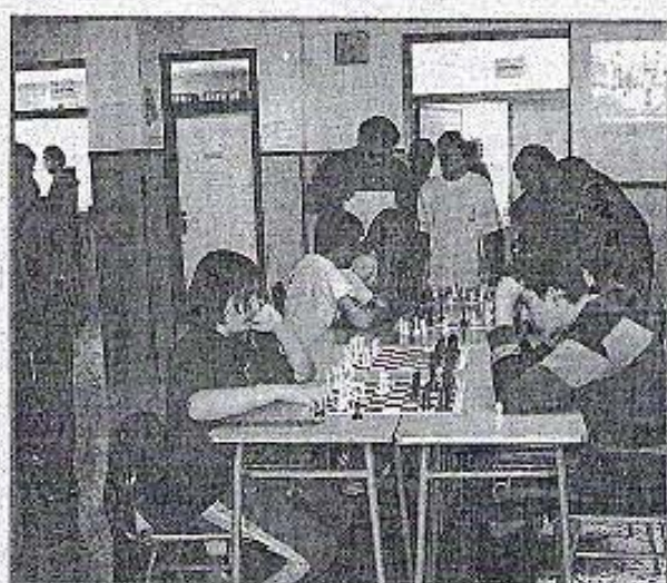
Algunos alumnos juegan al ajedrez en Andorra